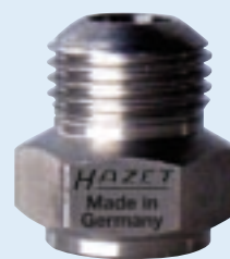
9170 A-7 SA