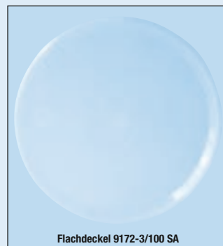
Flachdeckel 9172-3/100 SA