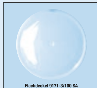
Flachdeckel 9171-3/100 SA