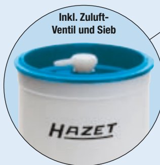
Inkl. Zuluft-Ventil und Sieb