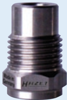
9170 A-2 SA