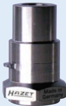
9170 A-4 SA