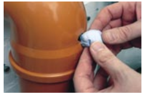
Reparatur eines PVC-Fallrohres