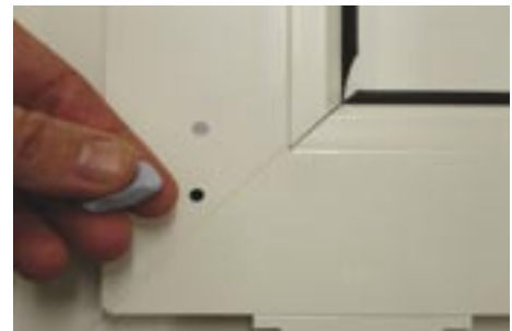
Ausfüllen von Beschädigungen an PVC-Rahmen