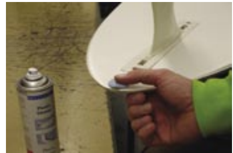
Reparatur eines Surfbretts