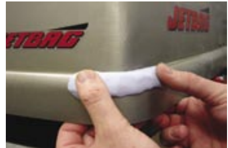
Ausbesserung einer Pkw-Gepäckbox